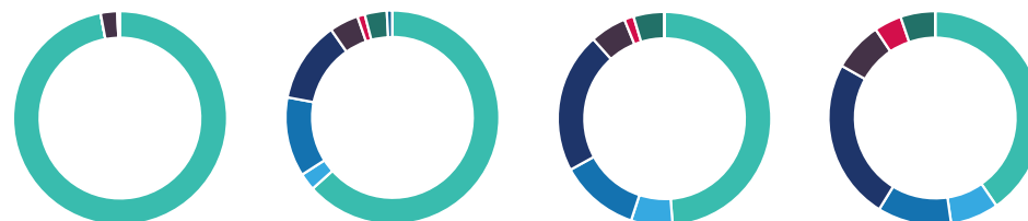
20 anos ou +