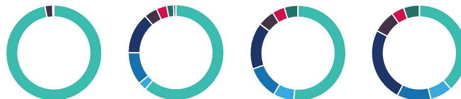
20 anos ou +