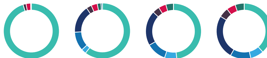
20 anos ou +